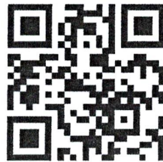
สโปตโทรทัศน์