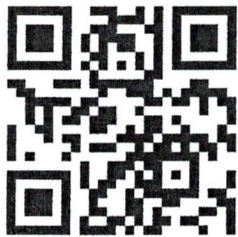
ข้อมูลประชาสัมพันธ์